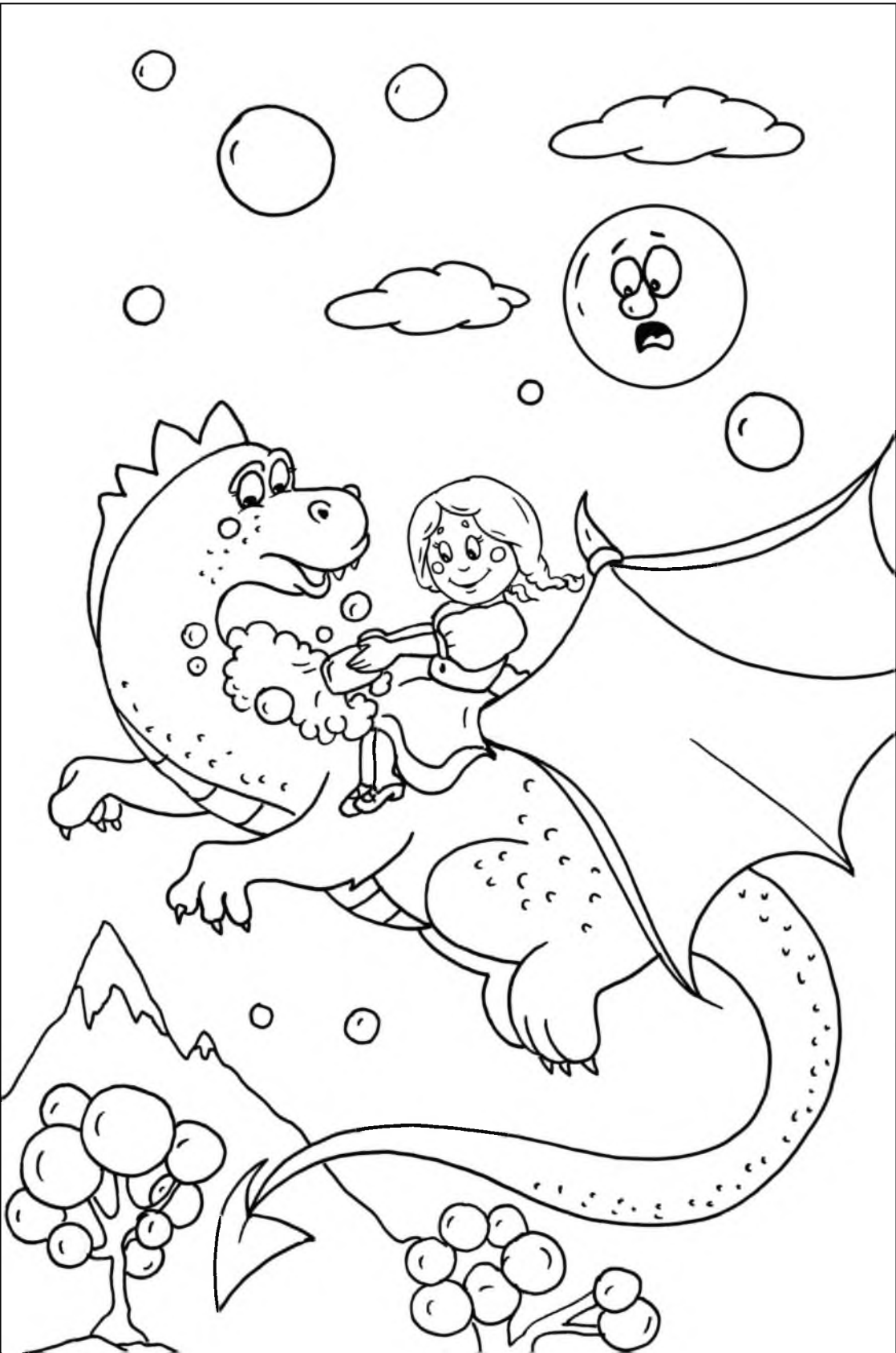
Катя, раскрась картинку цветными карандашами!